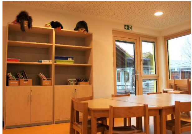
Intensiv- und Sprachförderraum