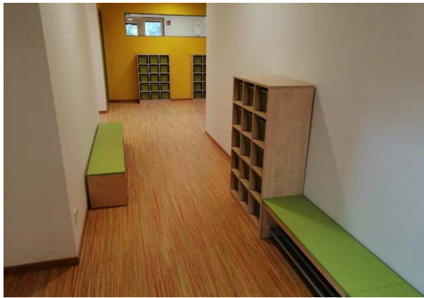
Garderobenbänke und Eigentumsschränke