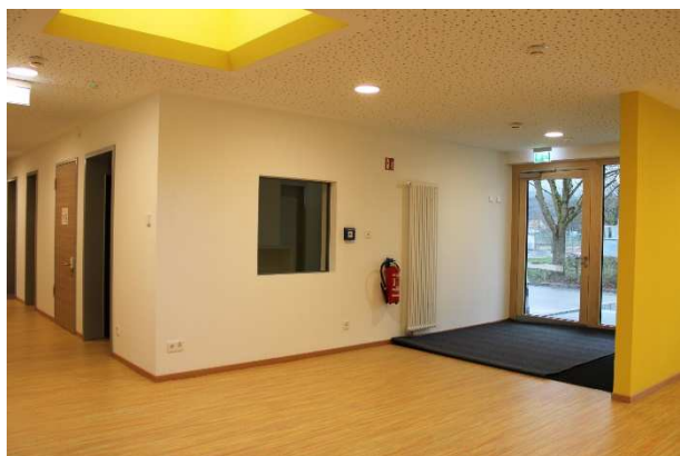
Eingangsbereich, neues Büro

Pustebume veröffentlicht werden, einen kleinen Einblick geben.