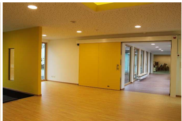
Verbindungsgang zum Bestandsbau