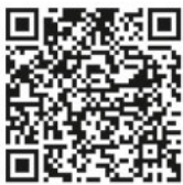
Meldeplattform Asiatische Hornisse

Sichtungen von Einzeltieren und insbesondere Nester sollen weiterhin ausschließlich über die Meldeplattform der Landesanstalt für Umwelt gemeldet werden. Dies kann über die Homepage der Landesanstalt für Umwelt (LUBW) oder über die kostenlose „Meine Umwelt-App“ erfolgen: